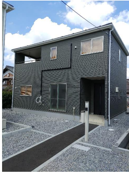
五個荘地域包括支援センター